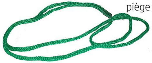
Cordon pour suspendre le piège