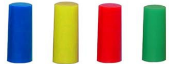
Phéromones à percuter et placer dans le panier Stocker les phéromones à 5°C max dans son emballage d'origine