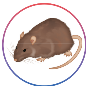
Rat brun Rattus norvegicus (adultes et juvéniles)