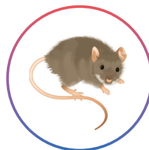
Souris Mus musculus (adultes et juvéniles)